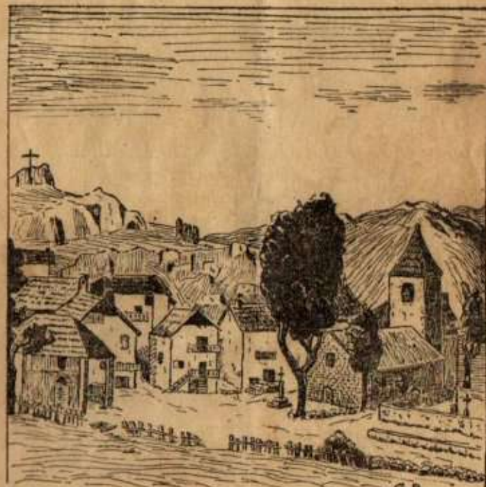
« Nos villages : Sauze »